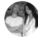
Zoren Gold / Photographer (右) Minori / Graphic artist (左)

There are many innovative ideas in this field of art and great qualities in the details. Japanese designs are constantly evolving and inspiring others.